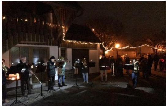
Mitsing-Andacht im Sternenglanz am 18.12.