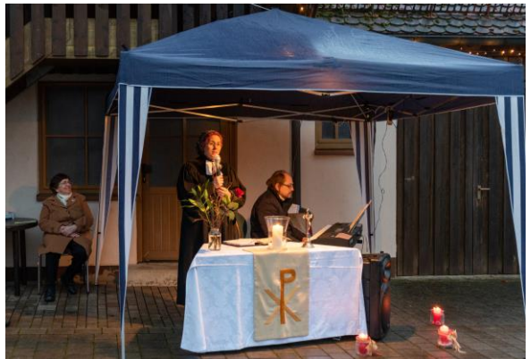
Familiengottesdienst am Hl. Abend