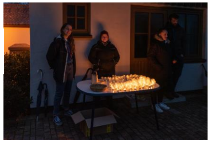
Die Pfadfinder verteilen das Friedenslicht