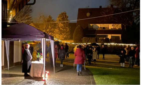
Christvesper und Weihnachtsbaum vorm Gemeindehaus